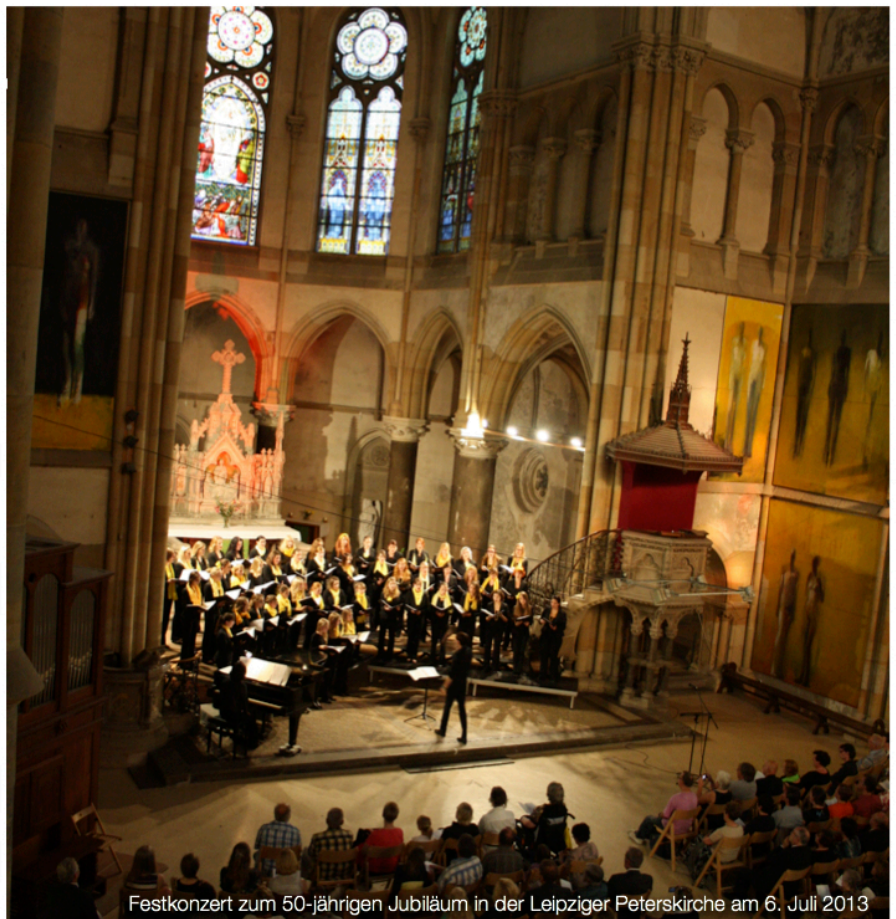
Festkonzert zum 50-jährigen Jubiläum in der Leipziger Peterskirche am 6. Juli 2013