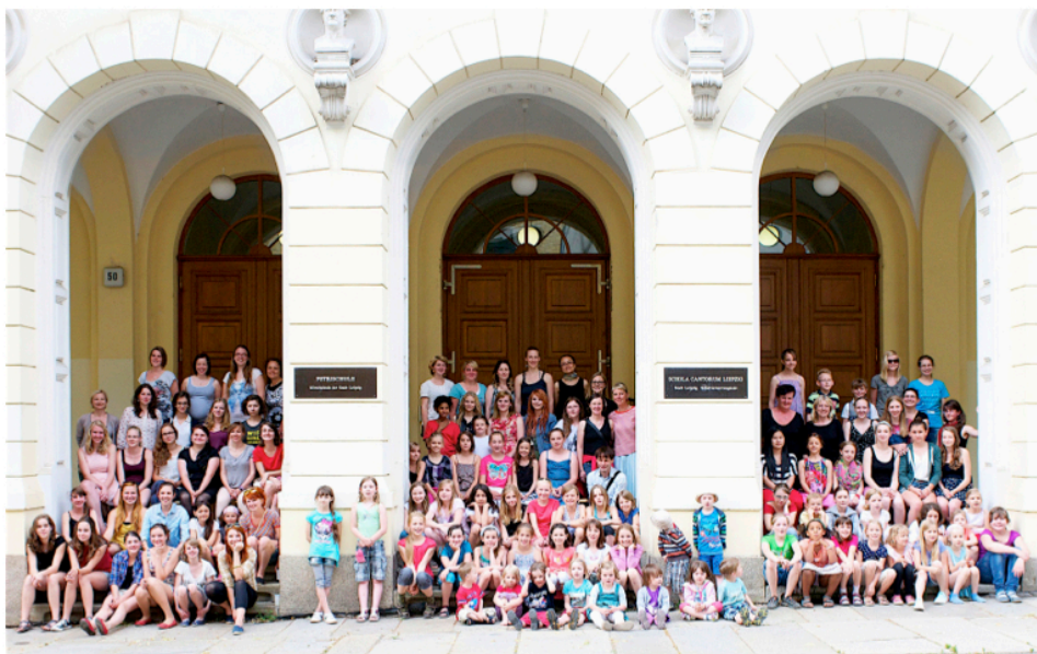
Das Jahrgangsfoto 2013 vor der Petrischule, entstanden im Anschluss an das Sommerfest der Chöre am 10. Juli 2013