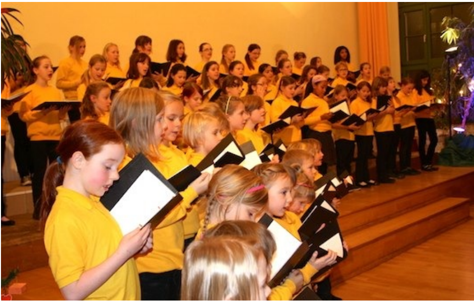
Weihnachtskonzert von Kinder- und Spatzenchor im Dezember 2013 im Beethovensaal