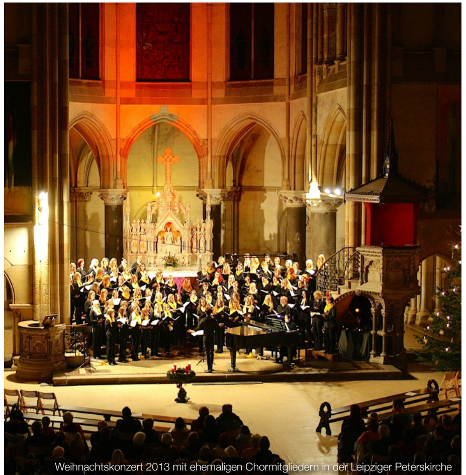
Weihnachtskonzert 2013 mit ehemaligen Chormitgliedern in der Leipziger Peterskirche